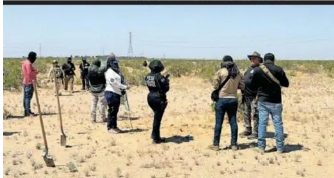
Colectivos de búsqueda de Baja California y Sonora participaron en el operativo de ayer en San Luis Río Colorado

CAMBIAN PLAN A COLECTIVO DE BAJA CALIFORNIA